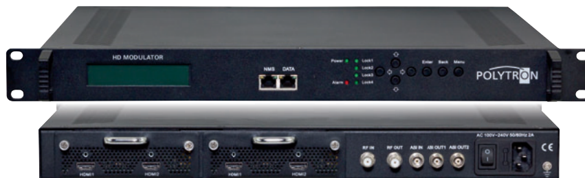
Vorderseite / Front